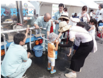
給水車から水をごくり

普段目にする事のない給水車や、見た目以上に重く感じる満水状態の非常用飲料水袋に驚きながら、大人も子供も防災について意識する良いきっかけになったと好評でした。