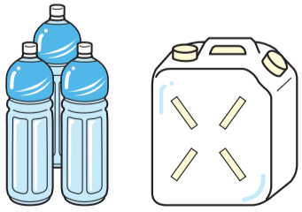
備蓄用ペットボトル水 保存用ポリタンク

災害時には、災害救助が機能し始めるのに約3日間かかると言われています。最低限家族分の飲料水を確保しておきましょう。