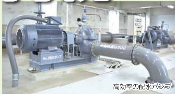
高効率の配水ポンプ

将来にわたって健全な水道事業経営を持続していくため、中長期的な財政収支見通しと適切な資産管理の下、経営の効率化や人材の育成と技術の継承、環境へ配慮した事業などの取組みを推進します。