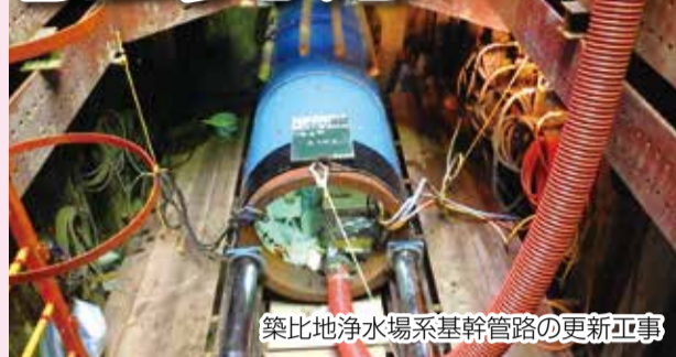
築比地浄水場系基幹管路の更新工事

将来にわたって安定的に水を供給し続けるために、地震等の災害に備えて、浄配水場や基幹管路など水道施設の耐震化を推進するとともに、危機管理対策の充実を図り、強靱な水道を構築します。