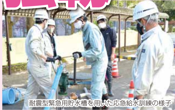
耐震型緊急用貯水槽を用いた応急給水訓練の様子

将来人口や水需要の見直しに基づき水道施設の適正化を図り、地震等の自然災害や事故などに備えて耐震化と更新を計画的に進めるとともに、危機管理対策の充実を図ります。