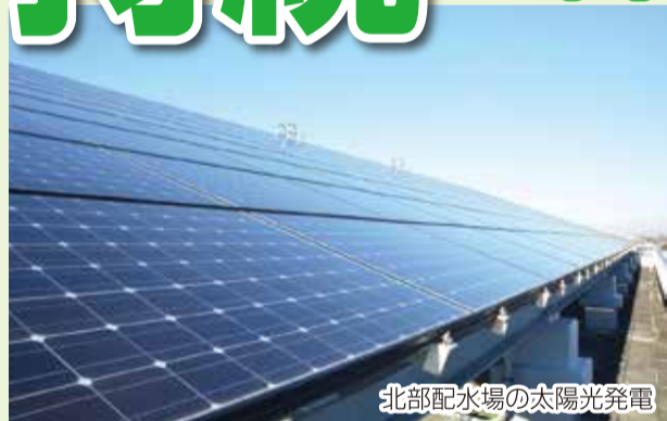
北部配水場の太陽光発電

将来にわたって健全な経営を持続していくために、計画的・効率的な経営のもとで人材の育成と技術の継承、環境への配慮などに取り組みます。